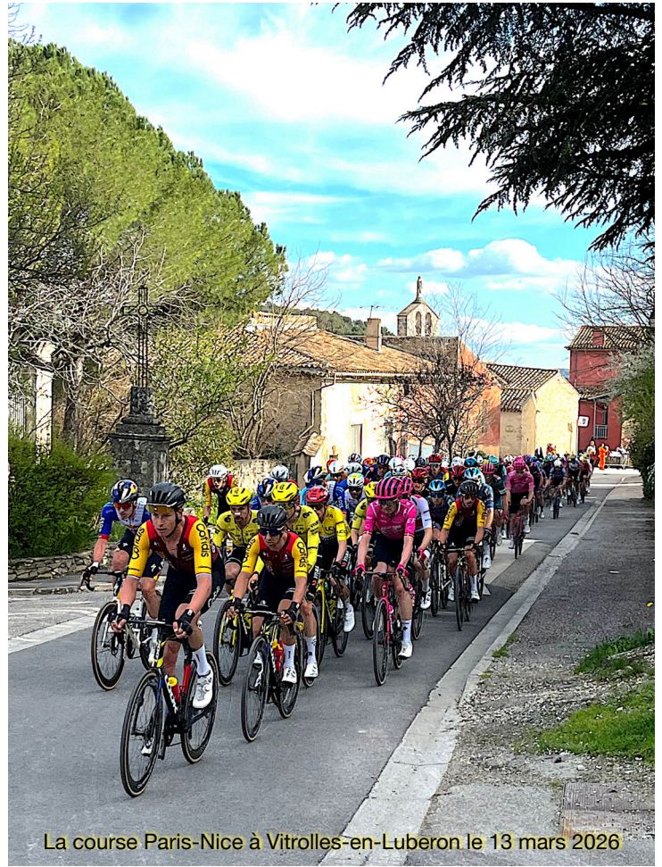
La course Paris-Nice à Vitrolles-en-Luberon le 13 mars 2026

NOUS VOUS ATTENDONS NOMBREUX ! LA MUNICIPALITE